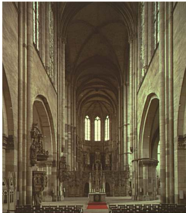
تصویر ۱ - فضای داخلی کلیسای جامع سنت موریتیوس (Saint Maurice Cathedral) در ماگدبورگ (Magdeburg)، آلمان. توجه کنید به مزار ایستر در گوشه پایین سمت چپ تصویر (Brockett، ۲۰۱۲: ۳۱).

این در حالی است که تمامیت زیبایی‌شناسی و کلیت هنر در قرون وسطی، وابسته به یک مفهوم کلی بود. مفهومی که تقریباً تمام فرقه‌های این عصر به حضور آن در آثار هنری تأکید داشتند. "حداقل توقعی که می‌توان از اثر هنری [در قرون وسطی] داشت کاربردی بودن آن است" (کوماراسوامی، ۱۳۹۳: ۵۵). در همین راستا آگوستین قدیس می‌گوید: "تو استعداد را آفریدی تا صنعتگر، هنر خود را به آن عرضه کند، و در درون خود ببیند آنچه را که باید در برون بسازد" (همان: ۶۸). فلسفه اواخر قرون وسطی، مفهومی را شکل می‌دهد که در آن، همه چیز، در هر زمان، نمود و مظهری از وجود خداوندی است. این امر را می‌توان به وضوح در مفهوم حضور فراگیر الهیات پان‌برگ نیز مشاهده کرد که به‌شکلی مشابه مفهوم جاودانگی و به‌موازات آن بسط می‌یابد.