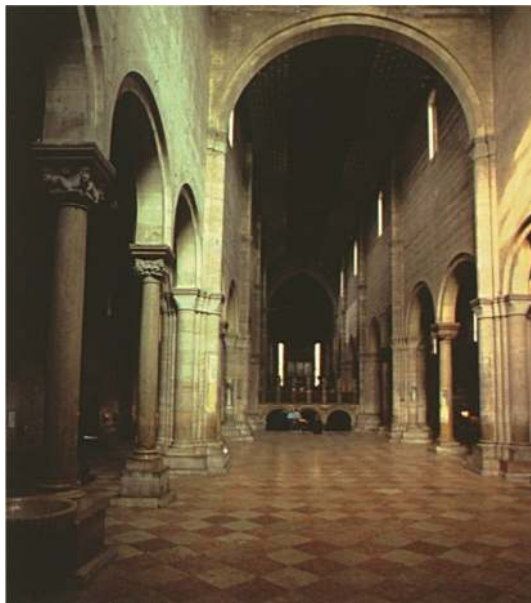
تصویر ۴ - فضای داخلی سنت زنوس (St.zenos)، یک کلیسای رومانسک (Romanesque) در ورونا، ایتالیا، قرن ۱۲. به قوس‌های زیر جابگه همسرایان که از آن به‌عنوان ورودی دوزخ استفاده می‌کردند توجه کنید.

آکوئیناس نیز درباره مکان دوزخ اظهار می‌دارد: "احتمالا دو مکان برای برزخ وجود داشته باشد: یک مکان درون زمین و نزدیک جهنم است به گونه‌ای که آن‌ها از یک آتش مجازات می‌شوند و مکان دیگر بالای زمین، جایی بین ما و خدا است. (بنی سعید لنگرودی، ۱۳۹۶: ۴۲). اما خرد کردن و تکثیر عمارت‌های گوناگون در طراحی صحنه نمایش‌های عبادی قرون وسطی را می‌توان در معماری گوتیک نیز مشاهده کرد. نوعی معماری شگفت‌انگیز که آن نیز برخی از اصول خود را وامدار انگاره‌های آکوئیناس است.